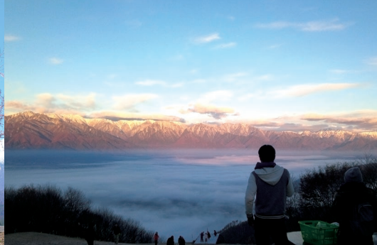
早朝、長峰山からの景色 8