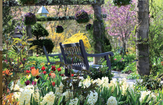
蓼科高原 バラクラ イングリッシュガーデン 8