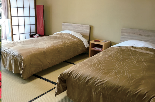
穂高荘ベッドのお部屋