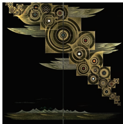
高橋節郎《星座煌煌》1988年

高橋節郎記念美術館（漆芸術の幻想的な世界）や礫山美術館、北アルプス連峰と安曇野の広大なパノラマを一望できる日本有数の美術館・北アルプス展望美術館を巡ります。帰路は白樺派が愛した幻の美術館「清春白樺美術館」を訪れます。