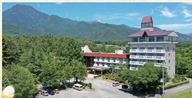
穂高号バス料金 ・宿泊代別 (4月から新料金)