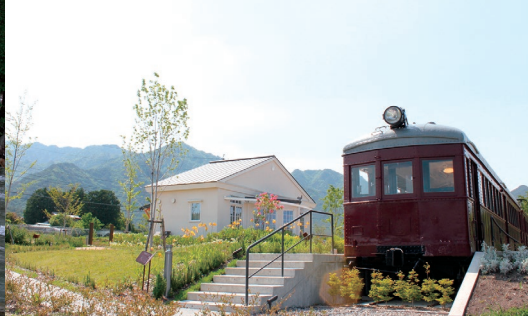
1 3 4 5 6 7 8 9 安曇野ちひろ公園