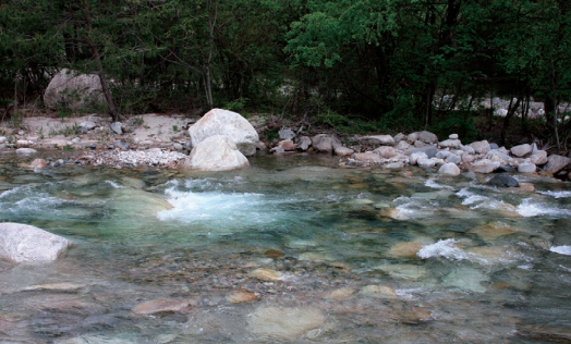
穂高荘近くの清流