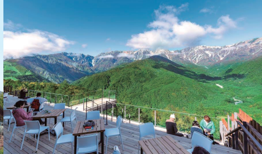
8 白馬岩岳 白馬マウンテンハーバー