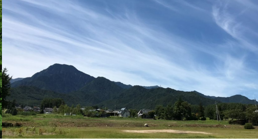
穂高荘から有明山